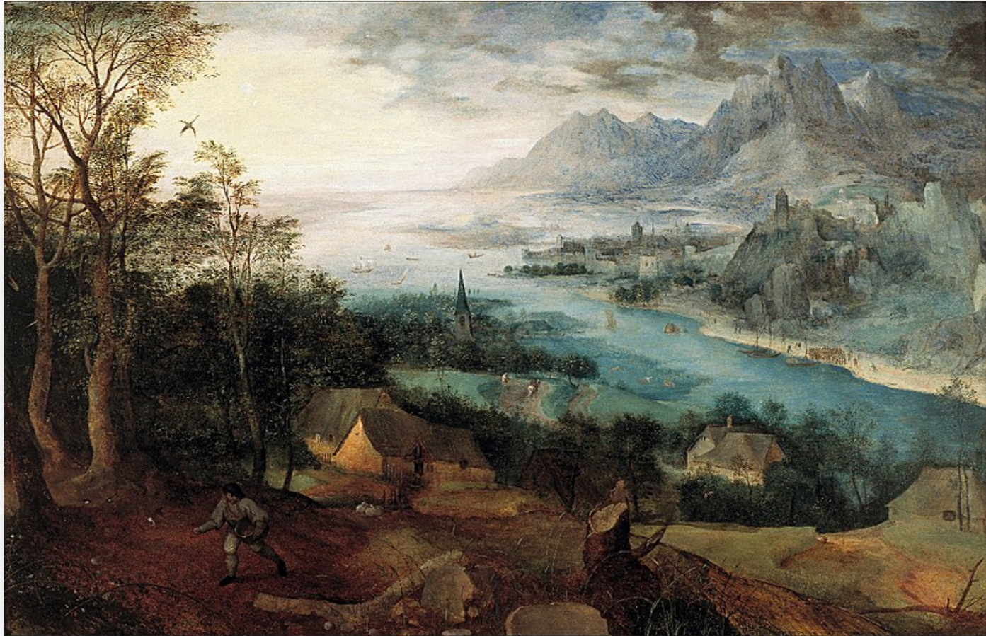
Parable of the Sower (Bruegel, 1557)